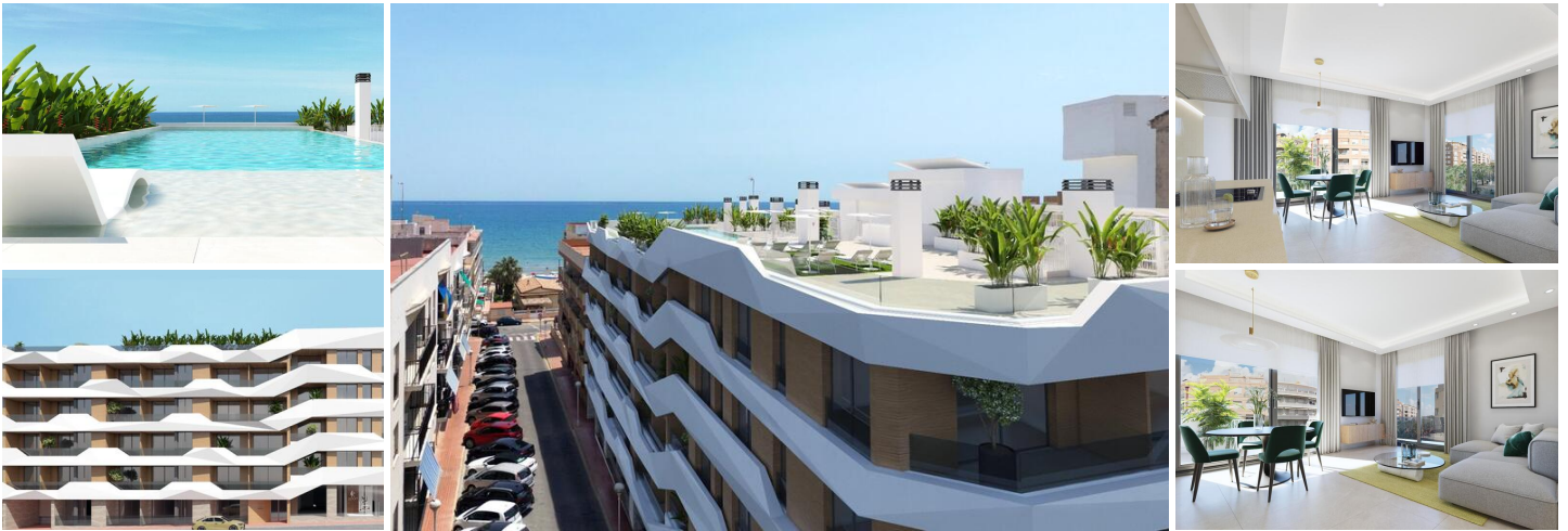
NEUBAU WOHNUNGEN IN GUARDAMAR DEL SEGURA

Neubau von Wohnungen und Penthäusern in Guardamar del Segura.