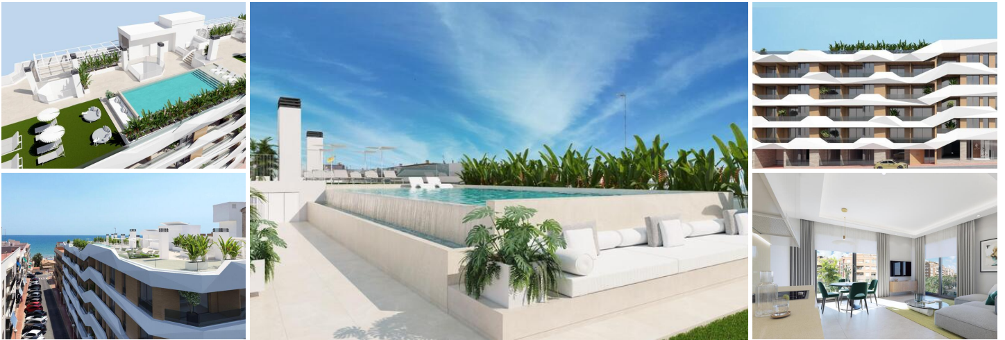
NEUBAU WOHNUNGEN IN GUARDAMAR DEL SEGURA

Neubau von Wohnungen und Penthäusern in Guardamar del Segura.