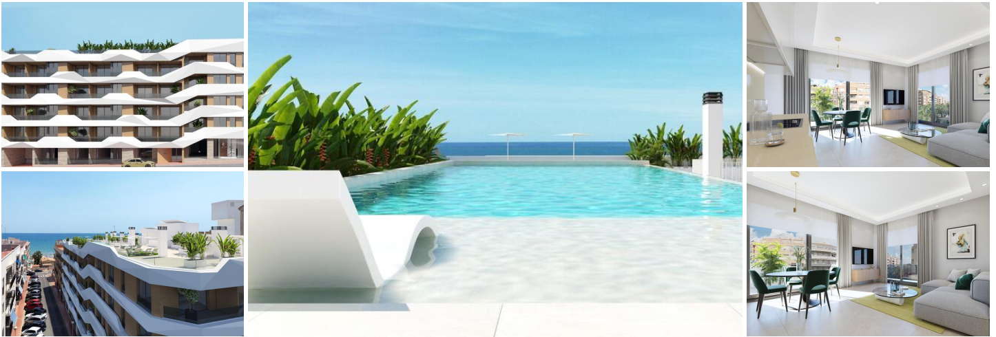
NEUBAU WOHNUNGEN IN GUARDAMAR DEL SEGURA

Neubau von Wohnungen und Penthäusern in Guardamar del Segura.