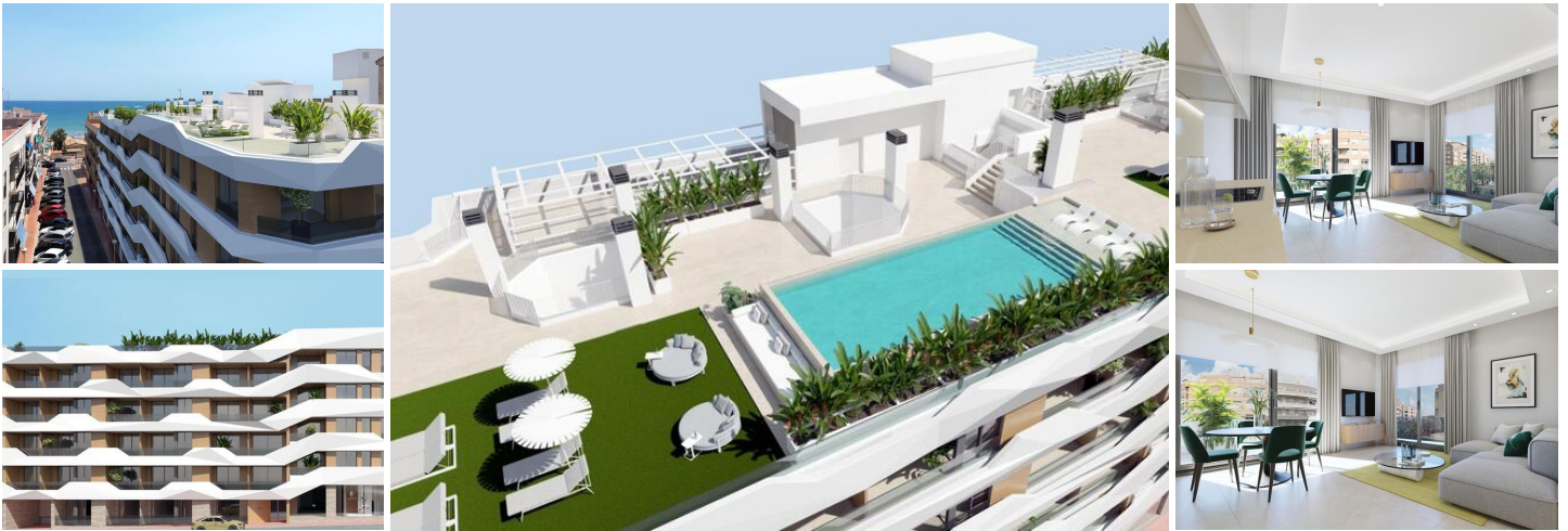
NEUBAU WOHNUNGEN IN GUARDAMAR DEL SEGURA

Neubau von Wohnungen und Penthäusern in Guardamar del Segura.