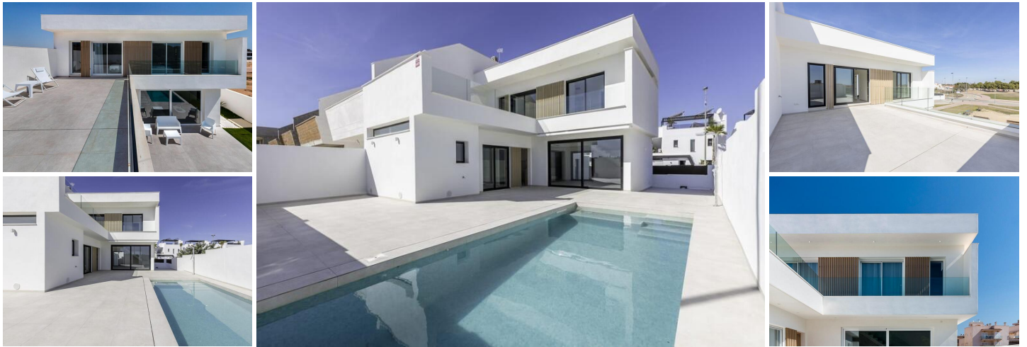
NEU GEBaute HALB-FREISTEHENDE VILLEN IN SANTIAGO DE LA RIBERA

Neu gebaute Doppelhaushälften mit 3 Schlafzimmern und 3 Bädern in Santiago de la Ribera.