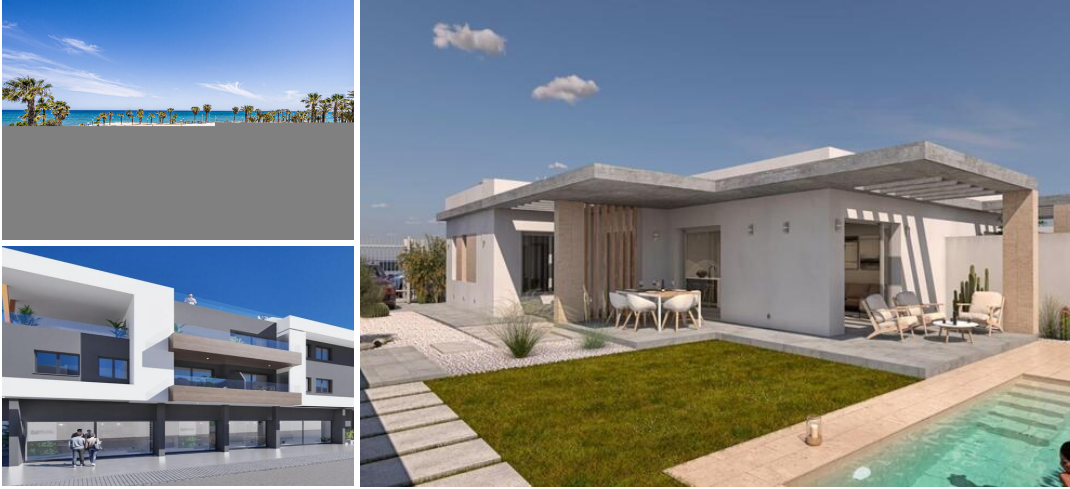
NEUBAU VON HALB-FREISTEHENDEN VILLEN IN SANTIAGO DE LA RIBERA

Neubau von modernen Doppelhaushälften in Santiago de la Ribera.