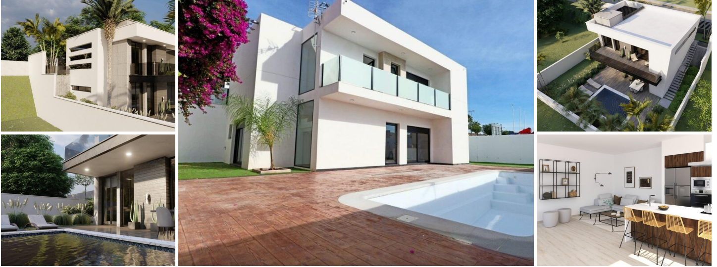
NEU GEBAUTE VILLEN IN FORTUNA