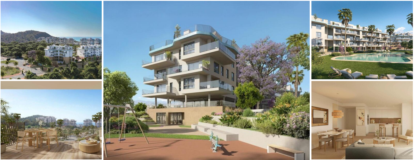
NEUBAU-KOMPLEX IN VILLAYOJOSA

Neue Wohnanlage mit 42 Wohnungen und Penthäusern in Villajoyosa, nur wenige Schritte vom Strand entfernt.