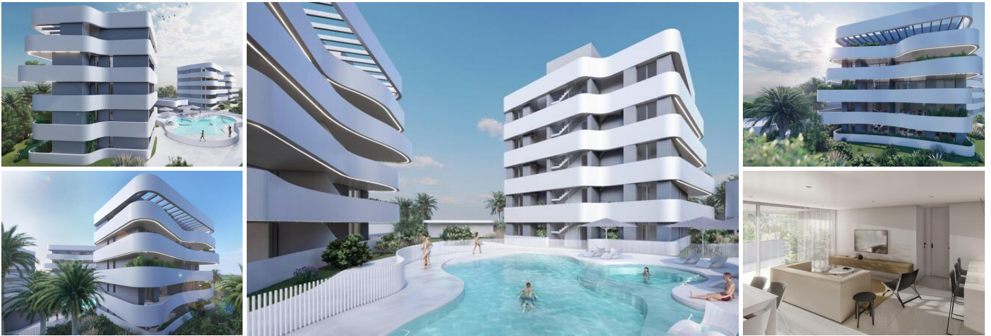
NEUBAU WOHNANLAGE IN EL RASO, GUARDAMAR DEL SEGURA

Neubau einer privaten Wohnanlage, bestehend aus 2-Schlafzimmer-Premium-Apartments und 2 oder 3-Schlafzimmer-Premium-Penthouses mit privatem Gemeinschaftsbereich und luxuriösen Annehmlichkeiten.