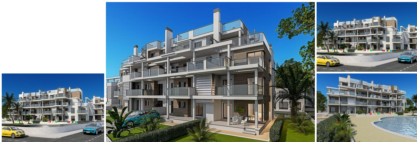
NEUBAU WOHNANLAGE IN DENIA

Die neue Wohnanlage wird 29 schöne Wohnungen mit Gemeinschaftspool haben. Neubauwohnungen mit 2 oder 3 Schlafzimmern, 2 Bädern, Garten oder Solarium und Parkplatz.