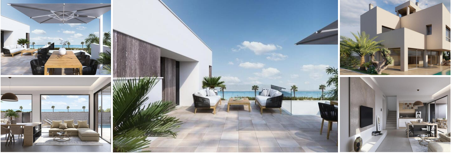
NEU GEBaute VILLEN IN TORRE DE LA HORADADA

Exklusive Wohnanlage mit 2 Luxusvillen mit Meerblick am Strand "Las Higuericas" in Torre de la Horadada.