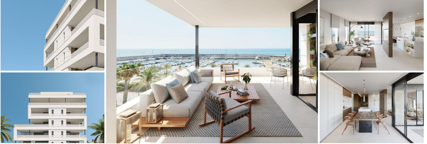
NEUBAU WOHNANLAGE IN AGUILAS

Neubau einer Wohnanlage mit insgesamt 11 Wohnungen und Penthäusern in Puerto Juan Montiel, Aguilas.