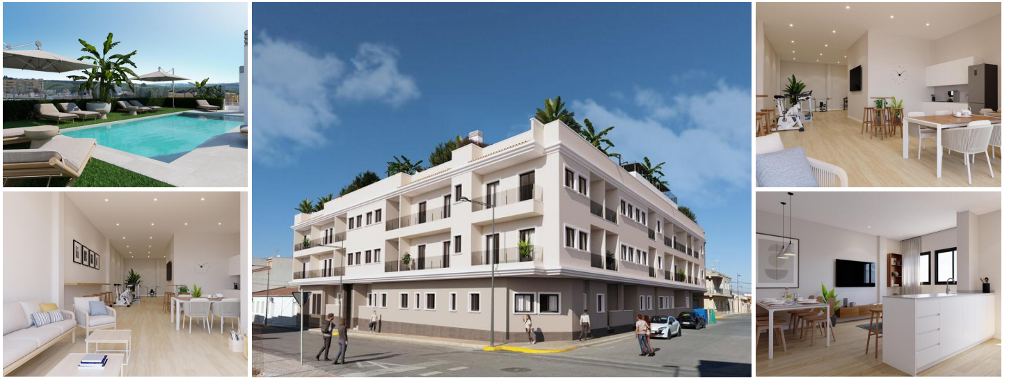
NEUBAU WOHNUNG IN ALGORFA

Neubau einer Wohnanlage mit 41 stilvollen Wohnungen und Penthäusern in Algorfa.