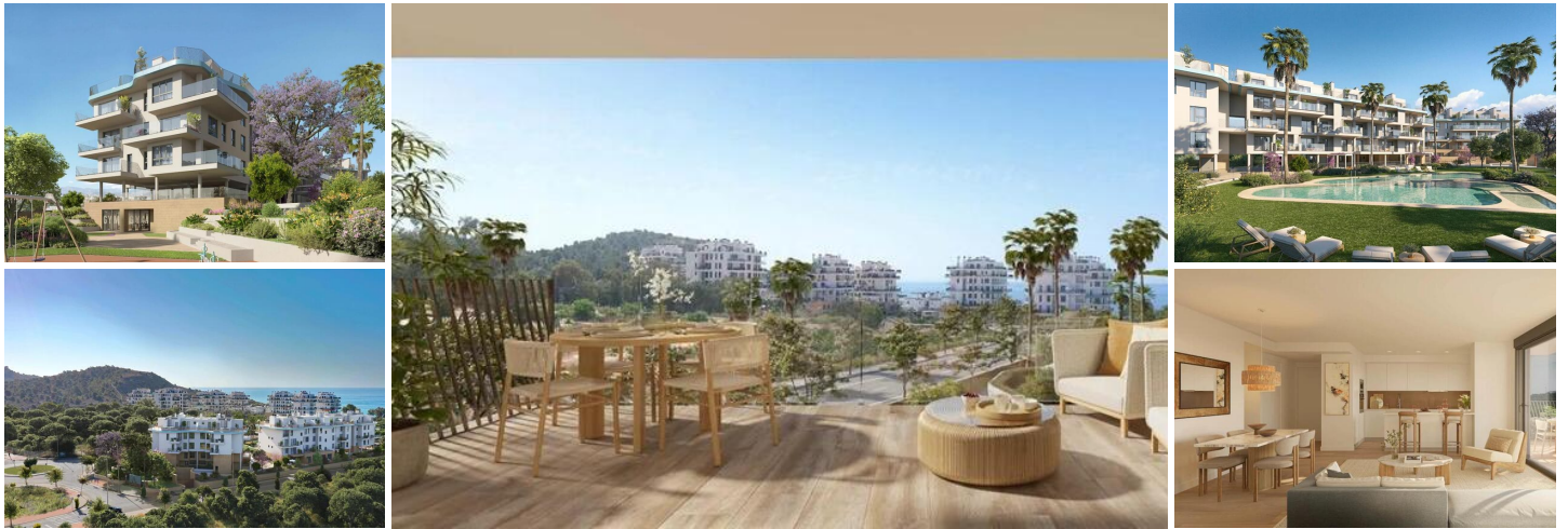
NEUBAU-KOMPLEX IN VILLAYOJOSA

Neue Wohnanlage mit 42 Wohnungen und Penthäusern in Villajoyosa, nur wenige Schritte vom Strand entfernt.