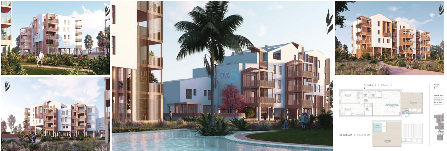
NEUBAU WOHNANLAGE IN EL VERGEL

Neubau-Wohnanlage mit Wohnungen und Penthäusern mit 1, 2 und 3 Schlafzimmern in El Verger, die als kompakte Strukturen konzipiert wurden, eine Antwort auf das ständige Streben der Architekten und Designer nach Effizienz in der Entwicklung. Diese Entscheidungen, die sich auf die verschiedenen Schlüsselpunkte des Wohngebiets verteilen, sorgen dafür, dass Ihr Zuhause sowohl im Winter als auch im Sommer die richtige Temperatur hat.