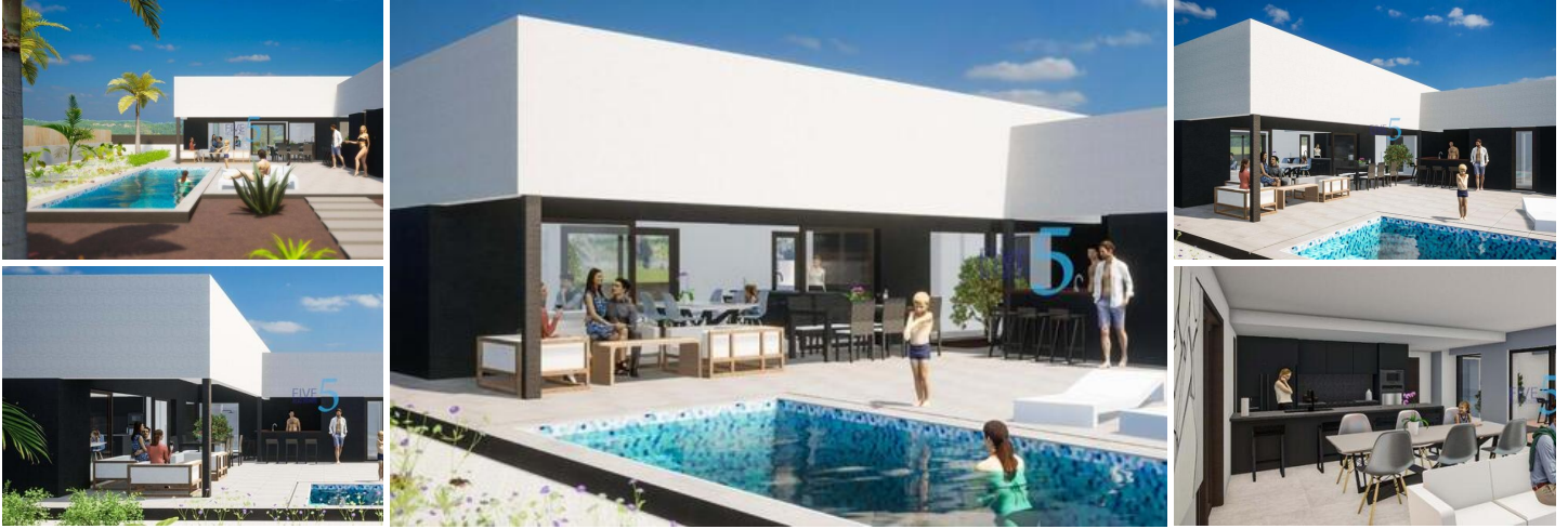
NEU GEBaute VILLEN IN ALFAZ DEL PI

Fantastische Neubauvillen in Alfaz del Pi, in der Nähe der Urbanisation El Arabi. Angeschlossen an das Stadtzentrum von Alfaz del Pi (Geschäfte, Sportzentrum, Schulen) und ein paar Minuten von El Albir mit einfacher Verbindung.