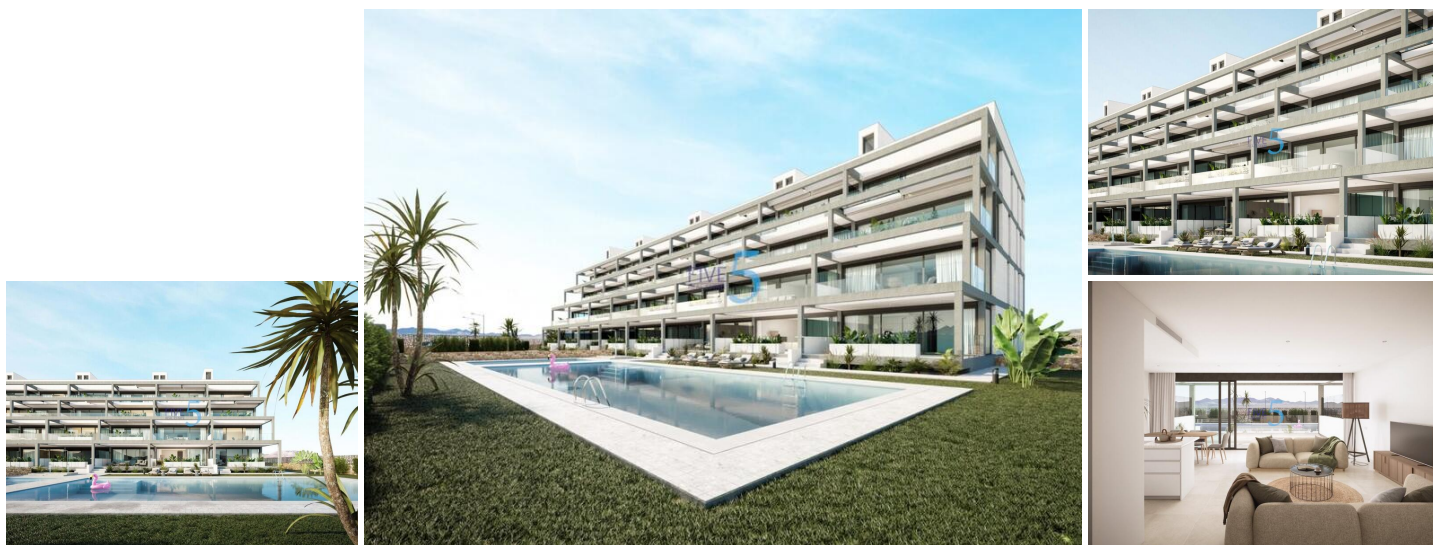
NEU GEBAUTE WOHNANLAGE IN MAR DE CRISTAL

Moderne Neubauwohnanlage mit Apartments und Penthäusern in unmittelbarer Nähe der Strandpromenade und der langen, schönen Sandstrände von Mar de Cristal.