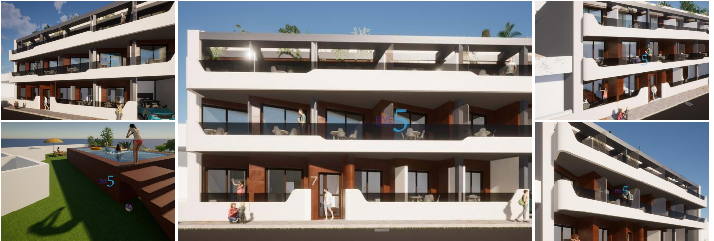
NEUBAU WOHNUNG IN TORREVIEJA

Neubauwohnanlage nur 3 Minuten zu Fuß vom Strand Los Locos entfernt, im Zentrum von Torrevieja.