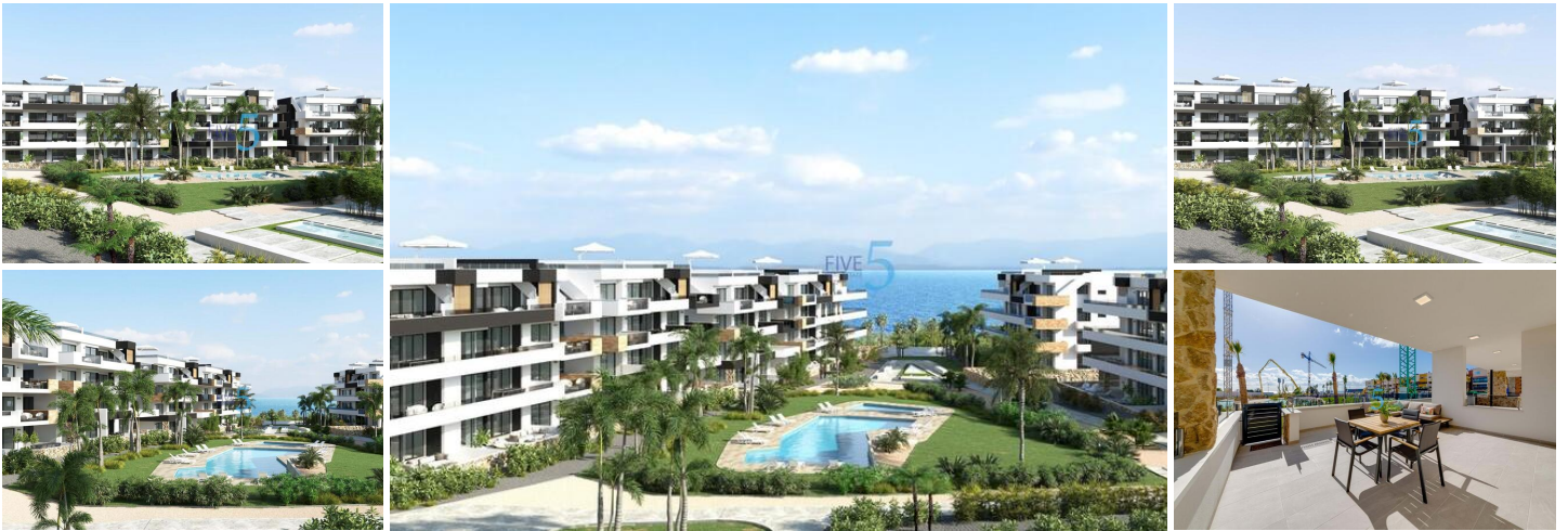
NEUBAU WOHNANLAGE IN PLAYA FLAMENCA

Neubau-Luxus-Komplex von Wohnungen mit 2 Schlafzimmern, 2 Bädern und großen Terrassen in Playa Flamenca in der Nähe des Meeres gelegen.