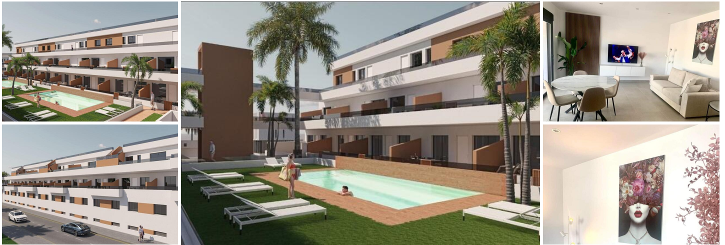
NYBYGGET BOLIGKOMPLEKS I PILAR DE LA HORADADA

Nybyggeri af lejligheder og penthouselejligheder i Pilar de la Horadada.