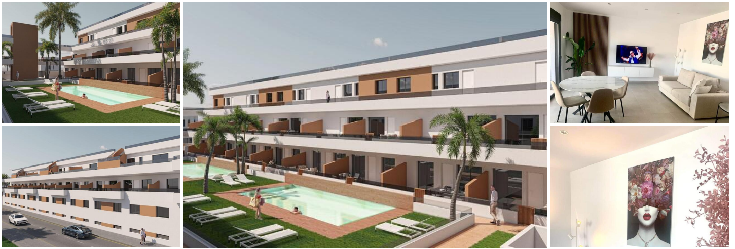
NYBYGGET BOLIGKOMPLEKS I PILAR DE LA HORADADA

Nybyggeri af lejligheder og penthouselejligheder i Pilar de la Horadada.