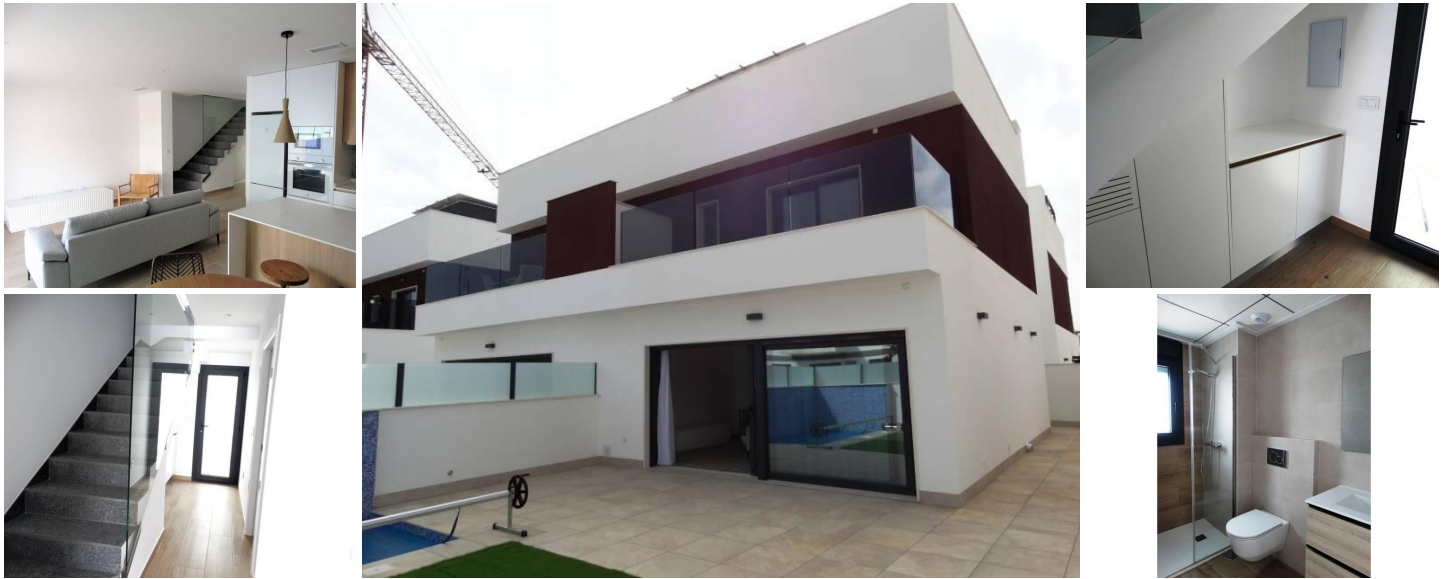
NYBYGGEDE PARCELHUSE I SANTIAGO DE LA RIBERA

Nybyggeri af 11 rækkehuse og dobbelte villaer i Santiago de la Ribera, 100 meter fra stranden!