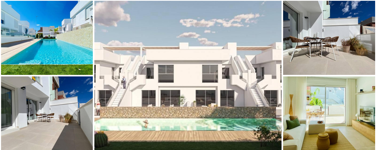
Nybygget bungalow-boligkompleks i Pilar de la Horadada