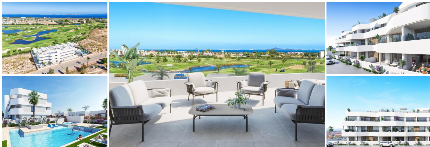
Nybygget boligkompleks i Los Alcazares

Los Alcázares er et idyllisk sted for dem, der ønsker at investere i en ny bolig på Costa Cálida. Kun 25 minutter fra Murcia lufthavn og ca. 55 minutter fra Alicante lufthavn er dette område bekvemt forbundet med motorvej til større byer som Cartagena, Murcia og Alicante samt til andre smukke strande langs Costa Cálida og Costa Blanca.