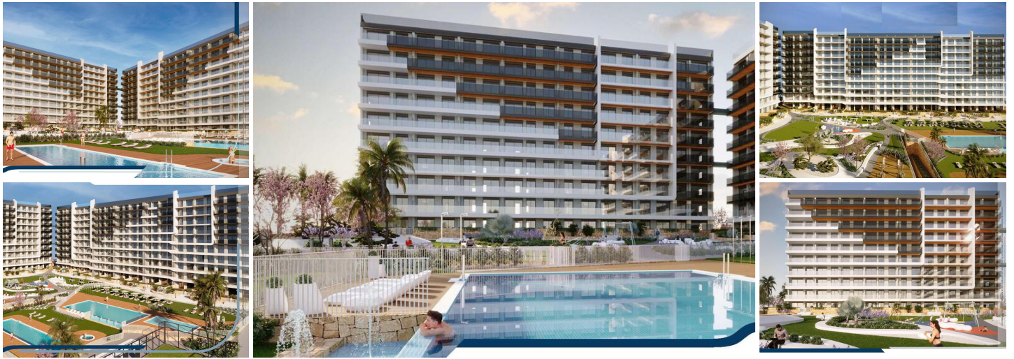
NYBYGGET BOLIGKOMPLEKS I PUNTA PRIMA

Nybygget boligkompleks med 220 lejligheder i Punta Prima, Torrevieja.