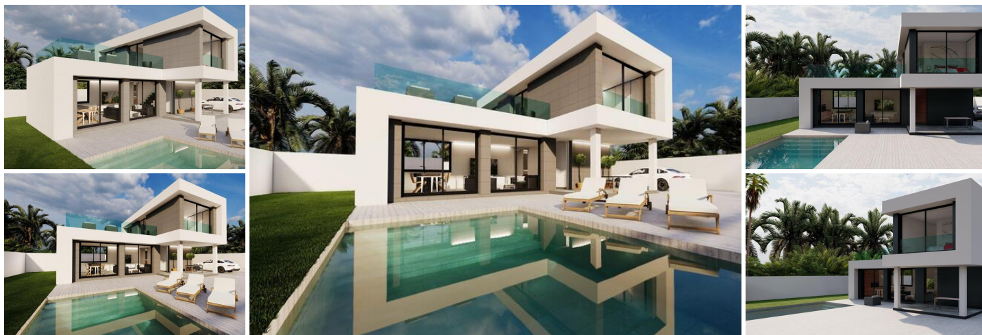
NYBYGGET VILLA I ROJALES

Nybygget moderne villa i Rojales tæt på alle faciliteter og tjenester.