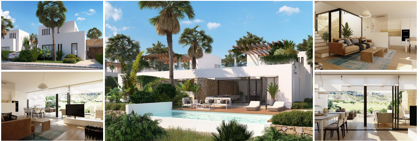
FRONT LINE GOLF NYBYGGEDE VILLAER I FONT DEL LLOP, ALICANTE

Nybygget semi-fredet villaer har 3 soveværelser, 3 badeværelser, åbent køkken med stueområde, indbyggede garderobeskabe, kælder, solarium, privat have med swimmingpool og parkeringsplads på grunden.